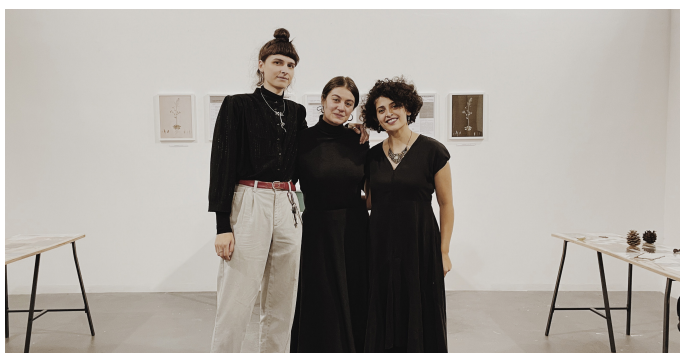
Al-Wah'at collective, Prix COAL