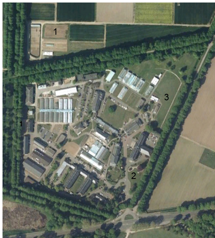
Terrains du site INRA de Versailles qui accueilleront les trois sections du dispositif expérimental : parcelle de l'ancienne serre « Closeaux » (1), pelouse « Entrée » (2), pelouse « Lanterne » (3)