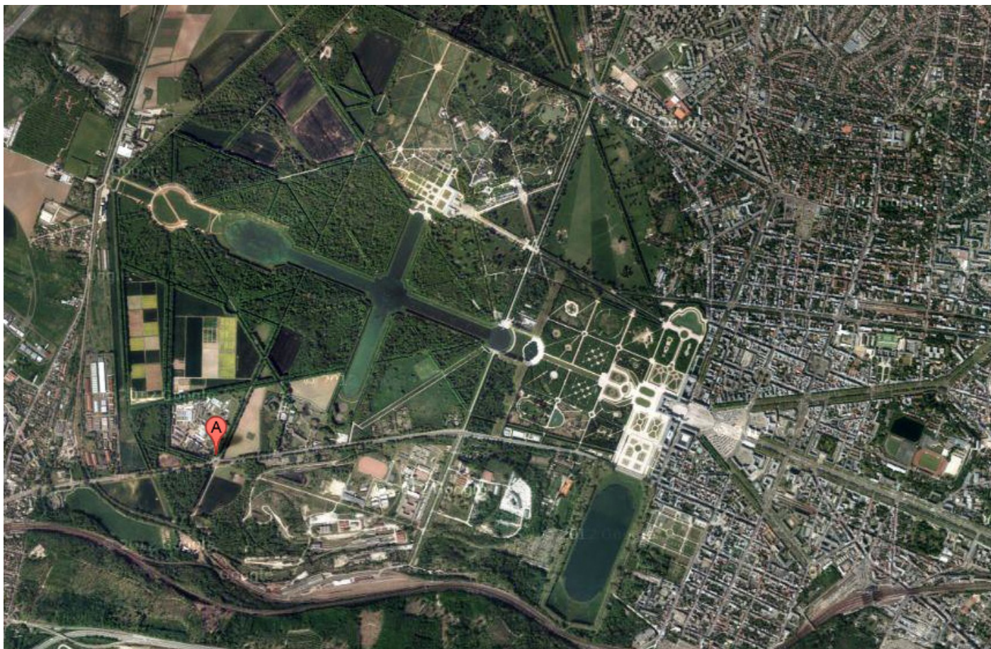
Localisation du Centre INRA (A) par rapport au centre de la ville de Versailles

L'ensemble du dispositif sera mis en place sur les terrains de l'INRA à Versailles, qui se situent à l'extrémité ouest du domaine patrimonial du château de Versailles. Il s'inscrira dans le programme de manifestations culturelles et artistiques prévues par la Ville de Versailles et le Domaine du Château pour l'année Le Nôtre 2013.