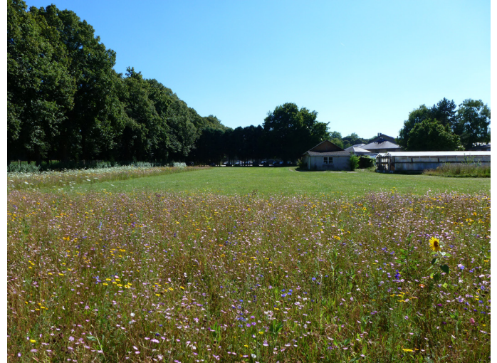
Pelouse « Lanterne » (Espaces Verts – site INRA de Versailles) en bordure de l'allée de Choisy