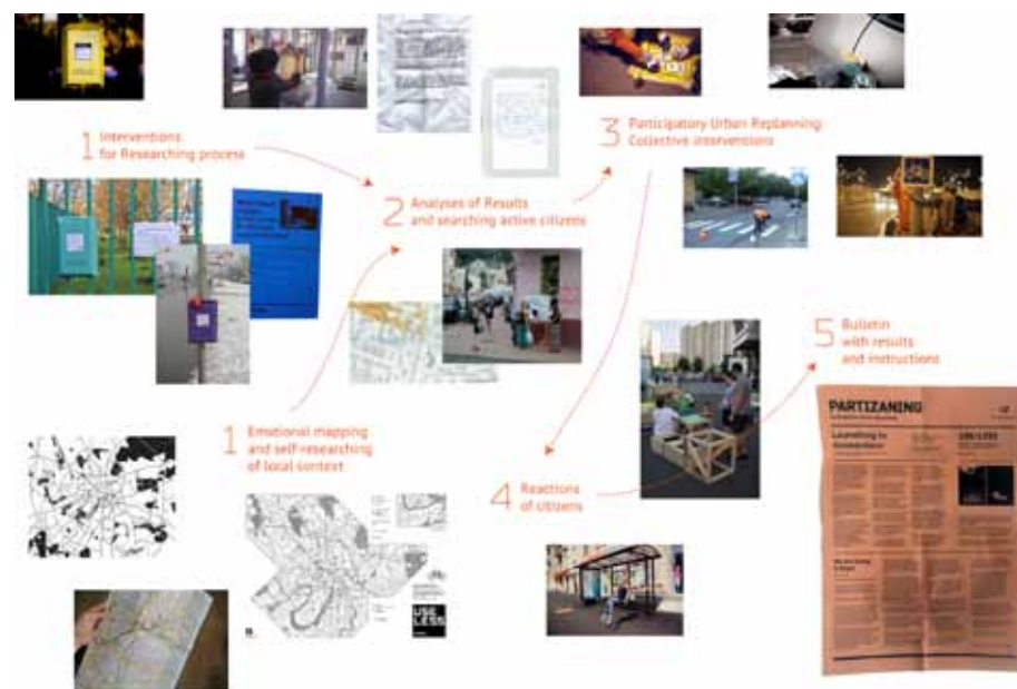
Ci-dessus et image en haut à droite : PARTIZANING, Illegal Urban Replanning, Moscou, 2012 . À droite, en bas : PARTIZANING, détails du projet .